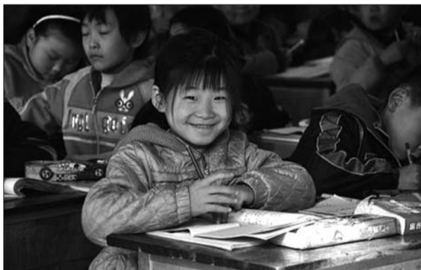
听说要有新书看,孩子们都很高兴。