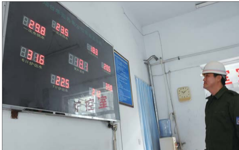
8日,华阳热电工作人员在查看供热显示板上的炉水温度。

从10月上旬,500供热公司各班组就陆续在单元楼内注水试压,目前二级网的注水试压工作已完成,工作人员正忙着