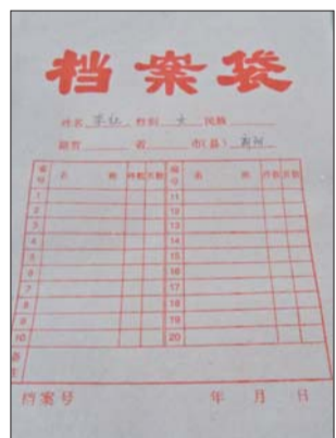
萃清小学学生的“成长记录袋”。

“我们希望用‘成长记录袋’记录下孩子在学校中的点滴,让家长放心,解决家长的后顾之忧。”萃清小学相关负责人杨吉福介绍。