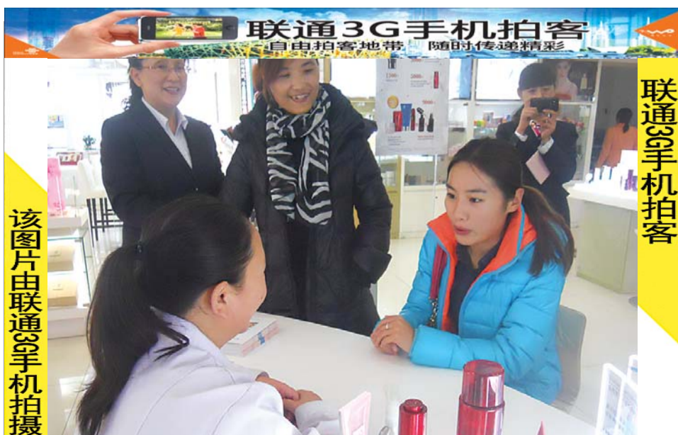
该图片由联通3G手机拍摄

14日下午,泰安市食品药品不良反应检测中心工作人员走进商场,向化妆品销售人员和市民讲解如何正确购买、使用化妆品,介绍化妆品不良反应知识。本报见习记者 路伟 摄