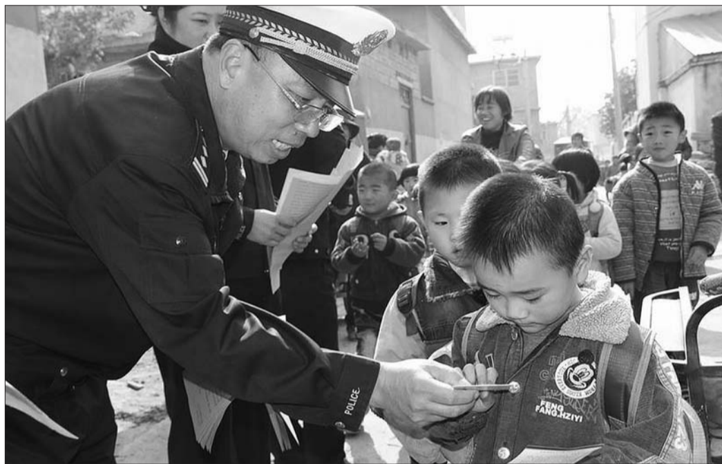
12日,市中交警大队民警到光明路街道东山阴村开展创满意大走访活动。民警深入农户,听取群众对公安交通管理工作的意见和建议,并走上街头,指导村民观看交通安全常识展板,向村民发放宣传挂图、光盘、宣传手册等交通安全宣传资料,提醒村民遵守交通法规,文明出行。当日共走访农户60余家,发放宣传资料1000余份。 本报通讯员 张伟 鹿稳 本报记者 袁鹏 摄影报道

另据记者了解,这6注双色球一等奖中奖恰逢双色球3亿元派奖活动期间,双色球3亿元派奖活动自10月24日开始,至年底结束,每期加奖1000万元给一等奖。这次全国共中出12注一等奖,山东省中出6注,除正常奖金外每注奖金还附加了833333元派奖奖金,6注奖金共增加了4999998元。