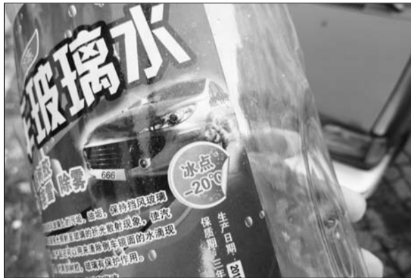
冬季要用具有防冻功能的玻璃水。

除了玻璃水记者了解到入冬之后车辆还有很多地方要特别注意。长期在枣庄地区使用的一般小汽车在冬季使用50/50比例的水与磷酸