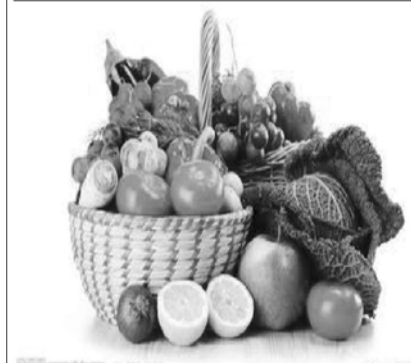
胡维勤教授谈“吃菜养心”疗法 绿色安全,简单实用

作为普通老百姓,都想知道名人日常保健方式和治疗疾病的办法,近日,作为特级保健医师胡维勤教授,多年来根据多位资深权威人士的食疗菜谱,向广大心脑血管病患者推荐“吃菜养心”的使用疗法,实现少吃药、不吃药防治心脑血管病的愿望。目前,这一疗法开始在全国普及推广。