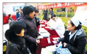
市民测血糖。本报记者 李岩松 摄