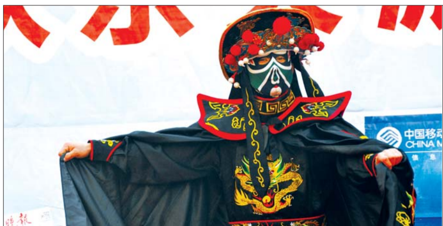
精彩的变脸表演。