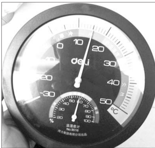
上午11点多,王先生家中室内温度为15℃。

上午11点多,王先生家里的温度计指针在15℃左右徘徊,他介绍说,因为3号楼是小区最北边的一栋楼,没有遮挡物,所以风格格外大,屋里也格外冷。他也想过安装天然气采暖炉,但又担心安全问题,没别的办法,只能开空调,“冷了就开开”,但这样对小孩不好,“空调风太干”。其实早在9月份开始