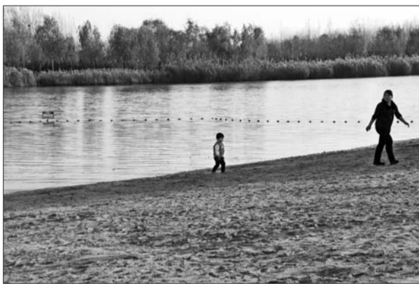
天气变冷后,减河湿地风景区内的游客越来越少。

记者了解到,不少景区利用淡季游客稀少的时期,完善游览项目、开发旅游商品、开发外地客源。黄河涯镇政府相关负责人周先生说,淡季万亩桃园加强了基础设施建设,完成3条总长12公里