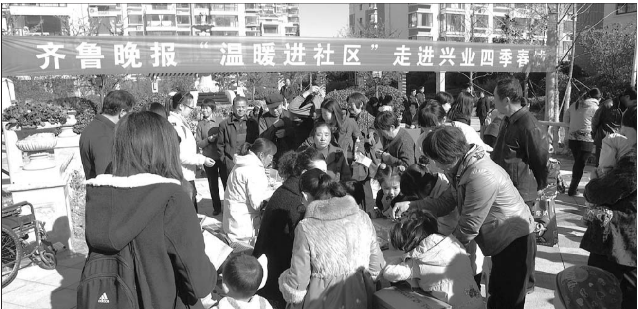
17日,在兴业四季春城,本报进社区活动受到众多市民关注。

如果您想读懂孩子的心理,想知道您的孩子心理是否健康,请参加本报的下一站“温暖进社区”活动,也可拨打本报咨询电话8308110。