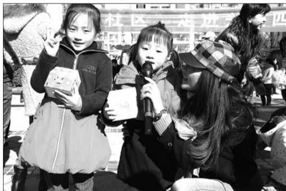
多才多艺小姐们,表现真棒!