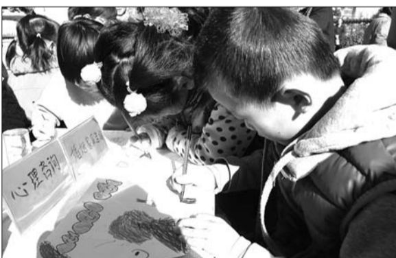
心理咨询展台被小朋友们团团围住。