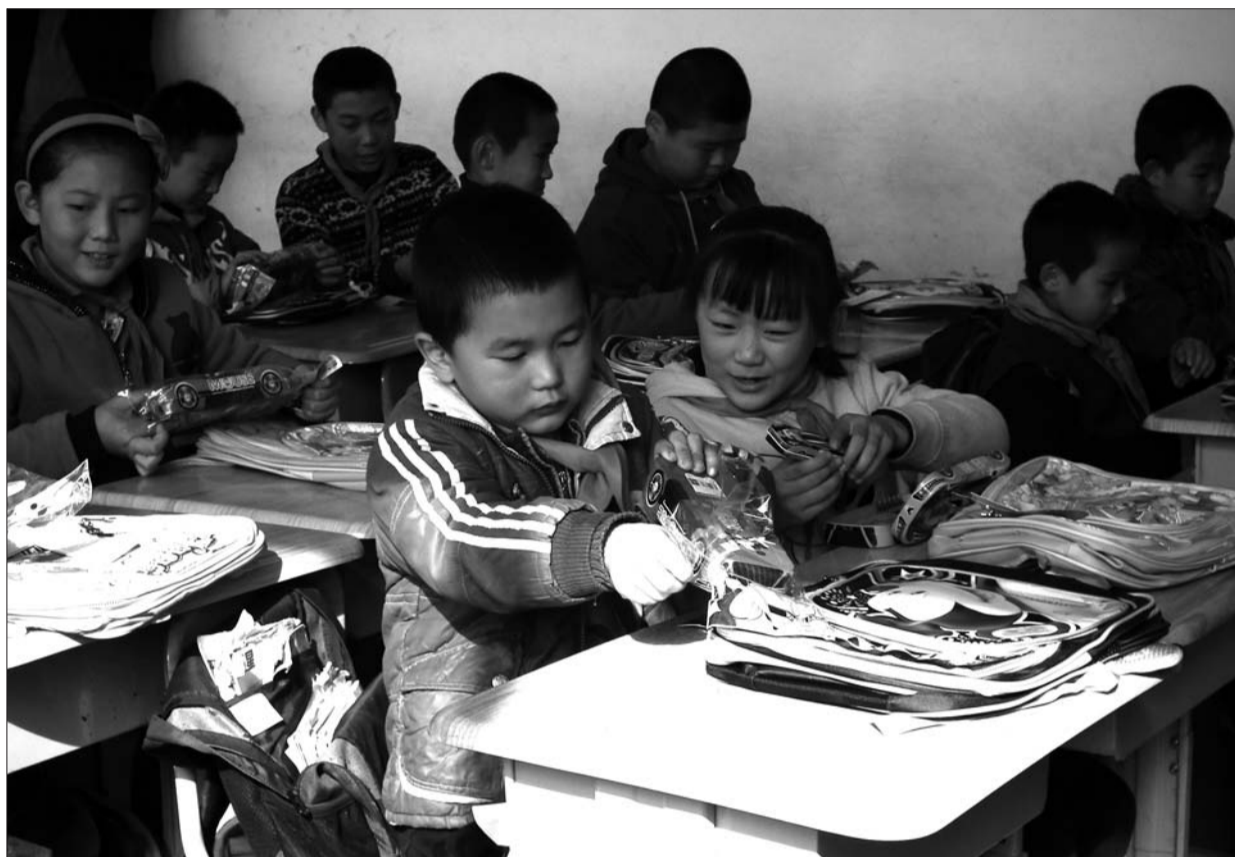
留守儿童收到礼物后,开心地拆开包装。

近年来随着农村外出务工人员的增多,留守儿童也在逐年增加。近期,记者走访鱼台、兖州、曲阜等地调查发现,农村留守儿童普遍存在,不少孩子一年才能与父母相聚一次,留守儿童心理问题逐渐凸显。