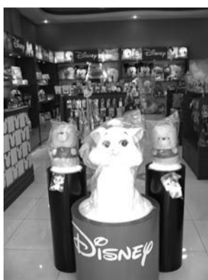
迪士尼店内时尚消费品。

位于百货大楼西门对过,主要针对具有较高文化品味、懂得享受生活、热爱时尚的职场精英、商政人士,产品张扬而不失内敛,时尚而不显媚俗,让羽绒服摆脱以往的笨重,力求使人们着装简约时尚,在精致中散发着成熟优雅的情怀。