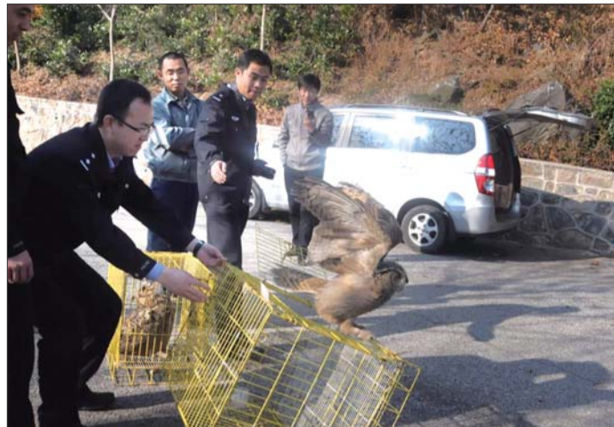
工作人员到山上将猫头鹰放生。

随后,民警们又驾车到两公里外的另一侧山地放生雕鸮。笼子打开后,两只大家伙起先都是原地不动,用可旋转180度的脑袋将周围的工作人员看了个遍。经过民警的驱赶,两只