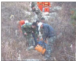
下山过程中乱石很多,救援人员只能用绳索下降接力的方法救援。

傍晚5点左右,经过救援人员绳索滑降、肩背等方法,伤者被成功营救到山下,送往当地医院救治。