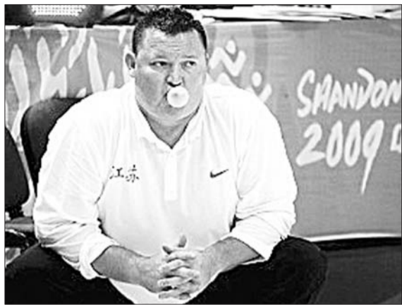
杰森以脾气火爆著称。