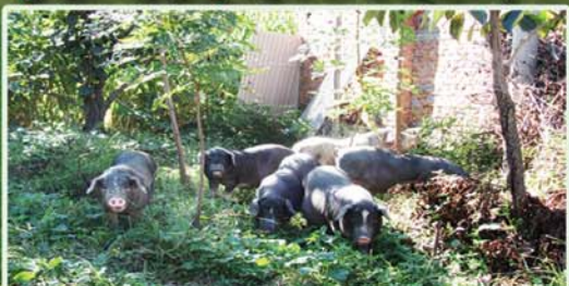
宏远集团年出栏3万头黑猪养殖基地