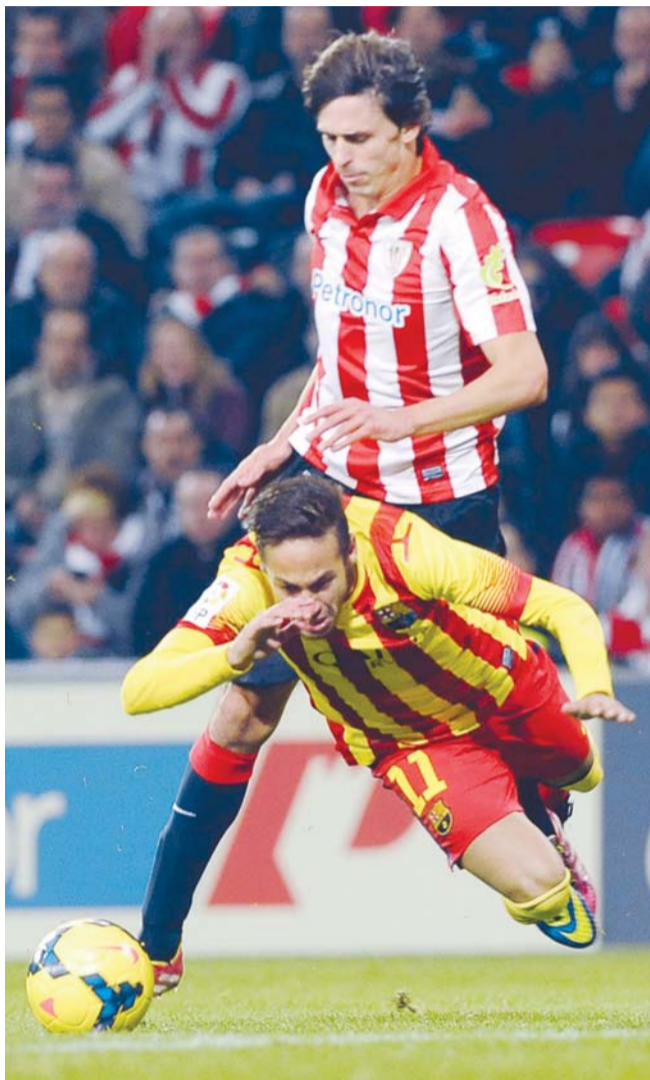
巴塞罗那遭到毕尔巴鄂的顽强阻截。

本轮过后, 毕尔巴鄂竞技跻身西甲前四, 巴萨在积分榜上仍然位列第一, 但与同积40分的马德里竞技相比只有净胜球的优势。