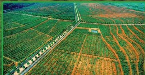
宏远集团5000亩苗木种植基地