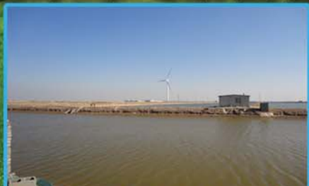
宏远集团万亩海产养殖基地