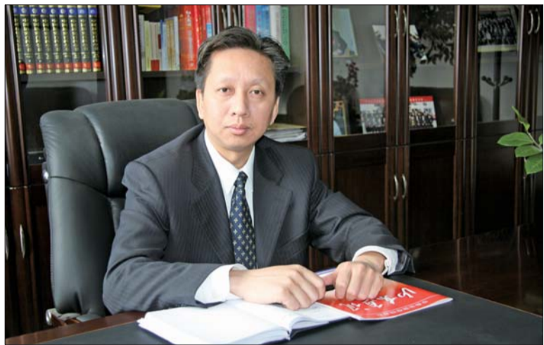
东昌府区委书记、区人大常委会主任李小平

12月2日,东昌府区委书记、区人大常委会主任李小平接受本报专访时表示,东昌府区围绕“跨越赶超”的奋斗目标,着力转方式、调结构,重点抓投入、上项目,全力扩内需、稳增长,通过“二次创业”的引领不断增强核心竞争力。