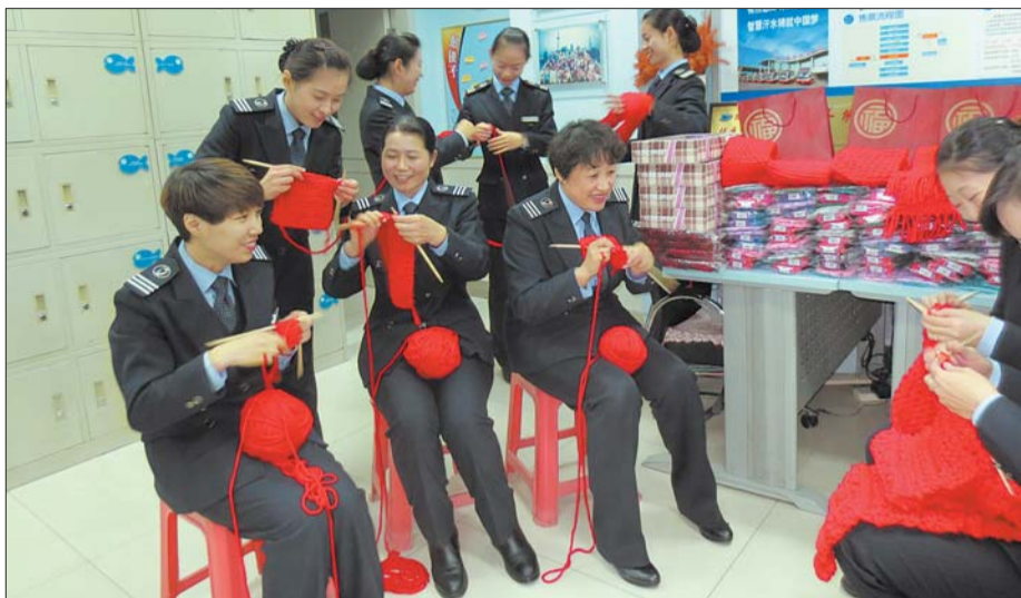
济南长途汽车总站的女职工们织着围脖,还不时地切磋手艺。