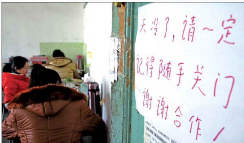
▲温度,对在教室里一坐就是一天的备考学生来说至关重要。