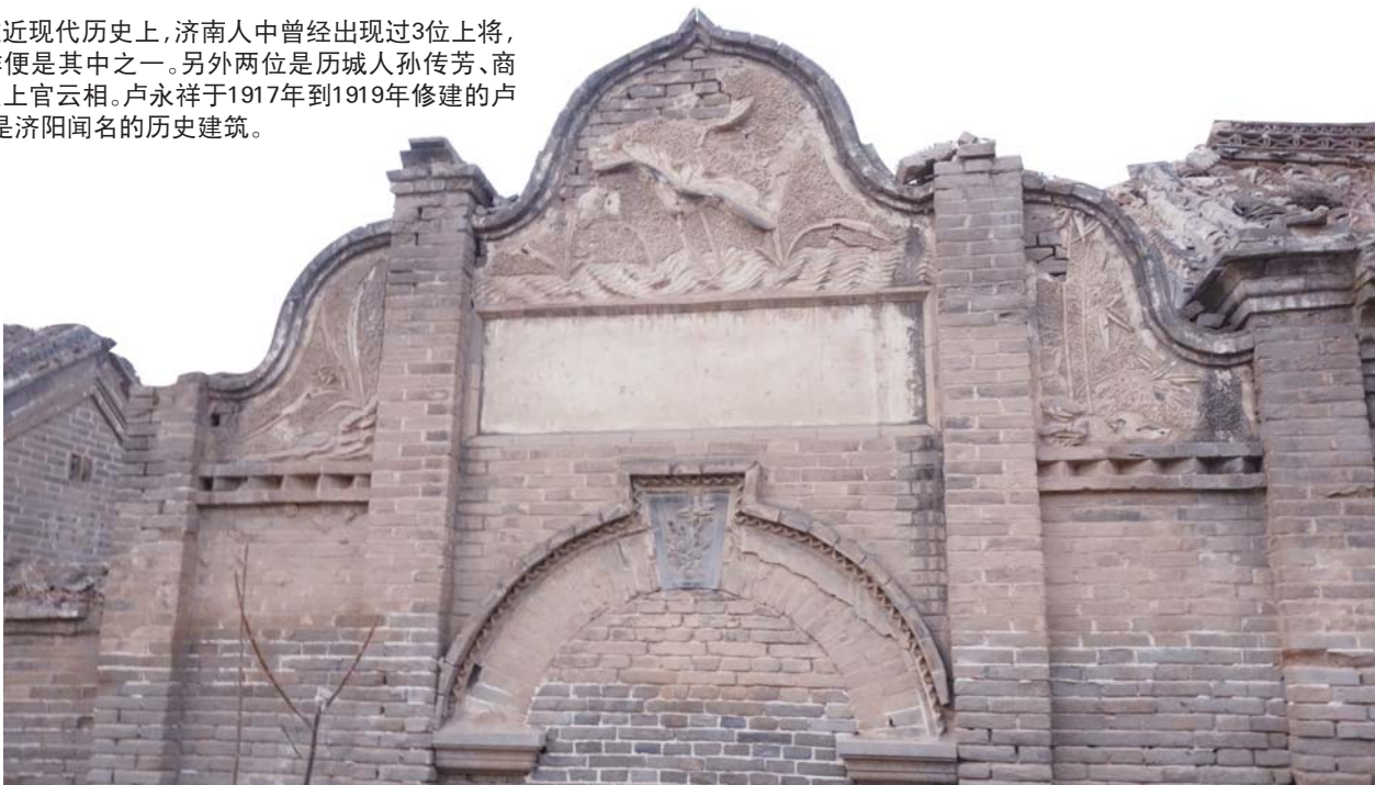
卢永祥故居东门上雕刻的莲花图案。

走进屋内,祠堂侍奉的卢氏牌位虽早已被撤走,但祠堂当年的威严气氛能让人不免正襟而立。屋顶高阔,一览无余,空荡荡的屋子让人感觉说话都有回音;涂黑的房梁与屋顶,黑压压的让人想到身为大家族的一员,自身的渺小与无助。