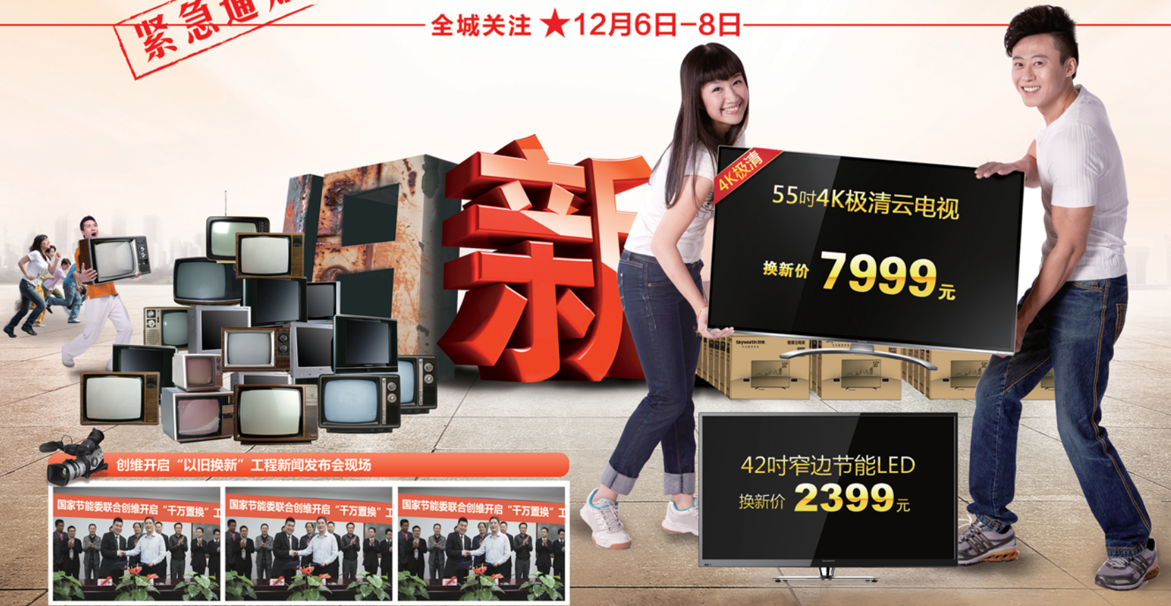
创维开启“以旧换新”工程新闻发布会现场