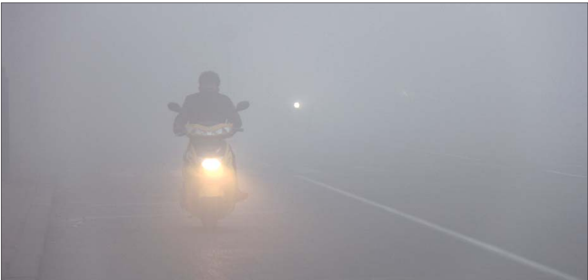
8日上午7点,黄河八路上的车辆在大雾中若隐若现。