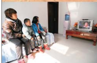
旧房新房对比,村民的生活条件得到了很大的提升。