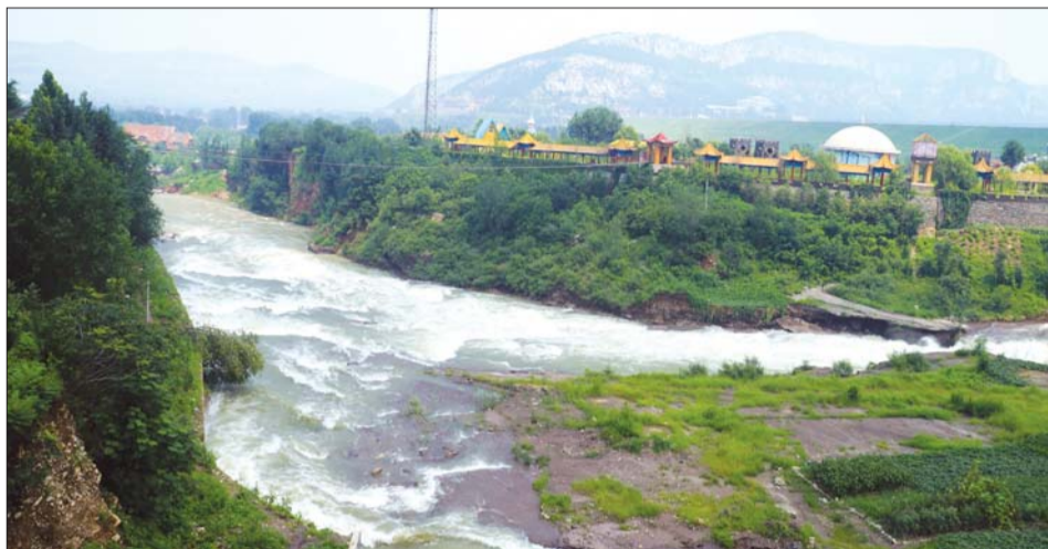
玉符河将进行综合治理。(资料片)

玉符河综合治理共分为5大工程,防洪工程、交通工程、治污工程、景观工程、配套工程。济南水利部门通过河槽、截流拦蓄、岸坡整理等工程建设,玉符河将达到50年一遇的防洪标准,可增加拦蓄雨洪水量约1200万立方米,形成约5300亩的水面,相当于6个大明湖的水面面积。