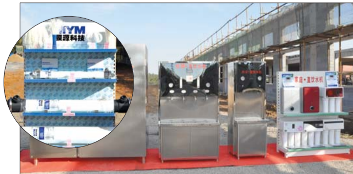
膜源水科技项目产品展示

大力实施城乡环境综合整治。以绿化、亮化、净化、美化为重点,加大环境综合整治力度,强化对主要干道、驻地环境的治理,城乡环境明显改善。投资80万元实施党家驻地路灯亮化工程,新安装太阳能路灯170余盏,结束了党家片区多年来没有路灯的历史。不断巩固取缔违法违规废旧塑料经营活动。