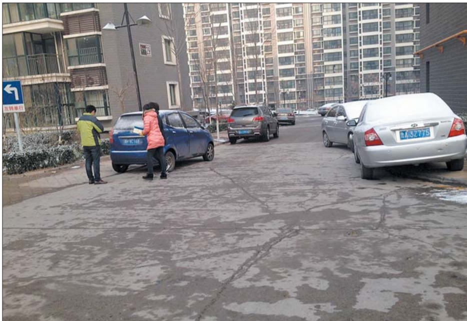
福泰新都城小区道路被机动车占据。

近一段时间以来,多地相继发生了高层住宅小区以及厂房的火灾事故,部分事故造成了较大的人员伤亡损失,尤其是汇科旺园小区的高层住宅大火,让人记忆犹新。近日本报接到读者反映,章丘多个小区也有因小区道路被车辆拥堵,或消防通道被占用的情况,给小区安全留下了隐患。记者对此进行了采访调查。