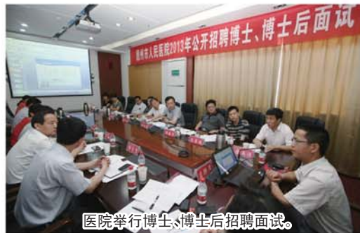
医院举行博士、博士后招聘面试。

两年来,是医院加速发展、管理逐步规范、患者持续受益的两年。经过这两年的跨越发展,德州市人民医院门急诊人次年均增长36.8%,出院人次年均增长20.5%,患者平均住院日下降了2.8天,医院业务收入结构调整取得重大突破,医院走上了一条健康、科学、可持续发展的道路。