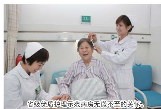
省级优质护理示范病房无微不至的关怀。