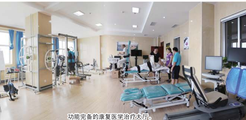
功能完备的康复医学治疗大厅。

人才是事关医院持续发展的关键,是提升技术水平、管理水平的决定性因素。为了做到“用好现有人才,引入急需人才,激活优秀人才,培养未来人才”,医院研究出台了《德州市人民医院中期人才发展规划》《加强高层次人才引进工作的暂行规定》等一系列文件。强化在职人员的培养,为中青年业务骨干提高业务能力搭建平台,与山东大学、潍坊医学院合作创办临床博士、硕士研究生教学基地,培养在读博士生52人。目前医院已拥有硕士、博士和博士后286名。医院广开引才渠道,通过公开招聘从高等医学院校引进各专业硕士研究生112人,招聘医院发展紧缺、有技术专长的实用型人才25人,招聘各类合同制工作人员270余人,为医院学科建设积蓄了一大批专业技术人才。