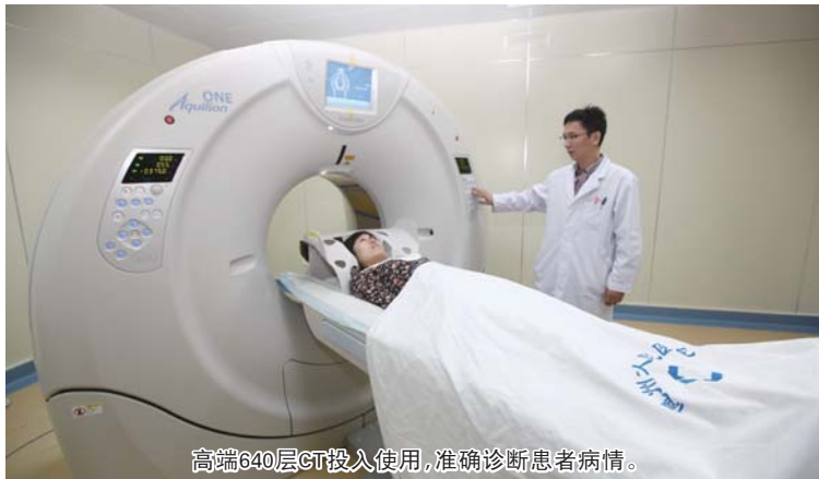
高端640层CT投入使用,准确诊断患者病情。

医学科学院联合成立了慢病工作室,被卫生部确定为脑卒中筛查与防治基地医院,与首都医科大学附属北京友谊医院、北京市消化疾病中心联合成立“消化疾病中心德州基地”。新引进北京专家直通车服务项目,以市人民医院为立足点带动北京各大医院优秀知名专家参与学术交流、业务协作。以上举措提高了医院医疗科研水平,提升了健康保障能力,提高了医院的核心竞争力。