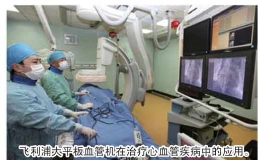
飞利浦大平板血管机在治疗心血管疾病中的应用。