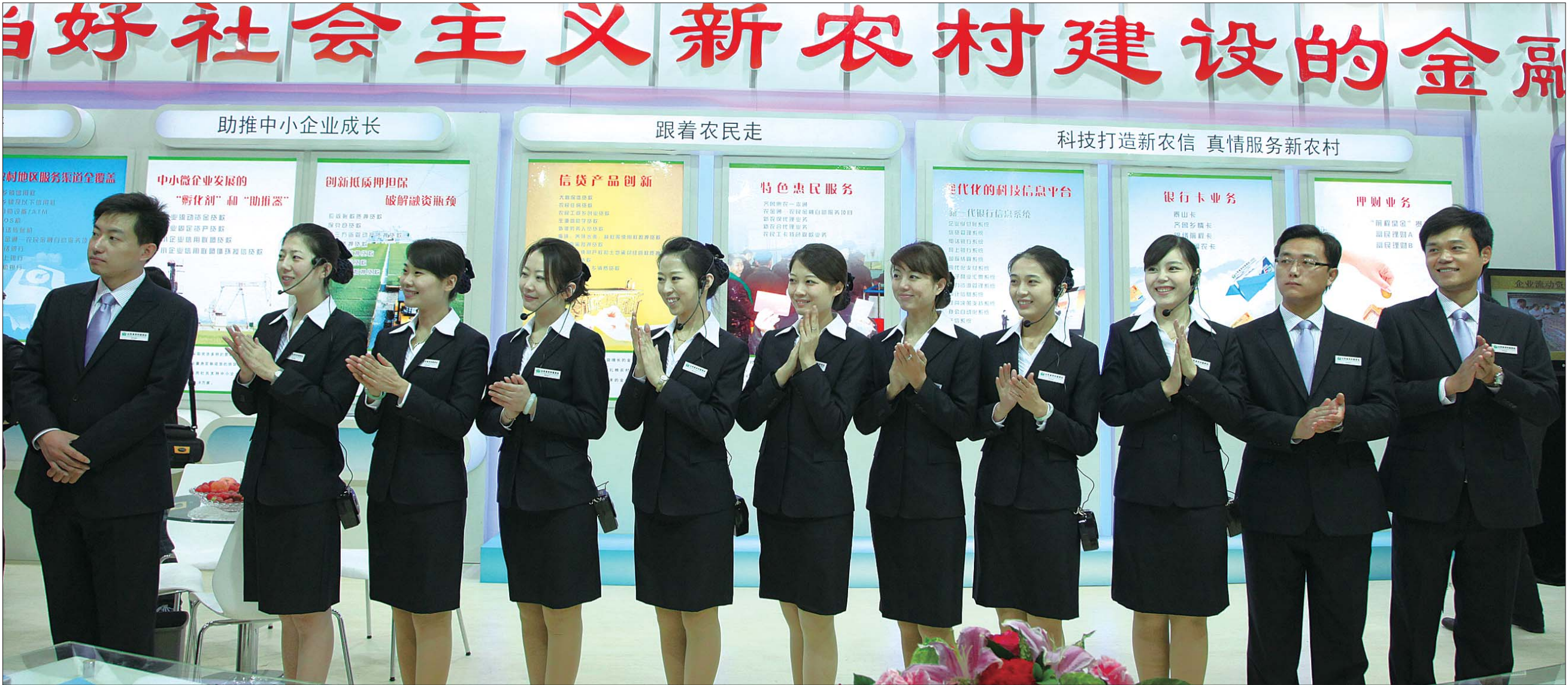
朝气蓬勃的员工形象。