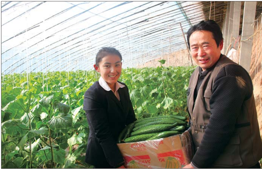
“百千万”支持下的“菜篮子”工程。

在从紧货币政策和企业融资难度加大的背景下,菏泽农信社始终坚持让利“三农”的原则,重点支持“五大基地”一大产业”发展,落实好各项惠农政策。