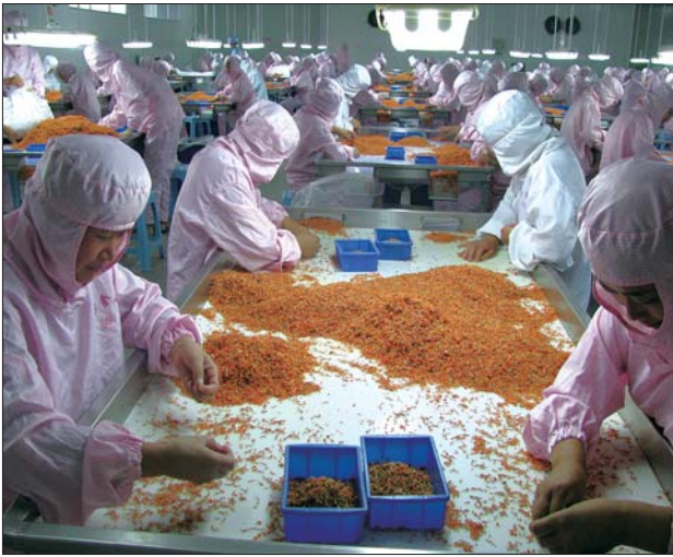
支持下蓬勃发展的中小企业。

工作。针对中小企业资金需求“短、小、频、急”的特点,该联社采取“放水养鱼”,大胆创新,对新型担保方式进行了有益的探索,在全市率先推出了钢结构抵押贷款,积极引导企业使用联保体抵押贷款、一户多保抵押贷款、联户联保体、仓单质押贷款等贷款品种,并积极引入鄄城县汇通担保公司对企业提供担保,实行利率优惠,满足中小企业不同“口味”的需求,开辟一条“贷款提速”通道。目前,全市实体贷款余额340.3亿元,较年初增加38.44亿元,新增占比52.72%。