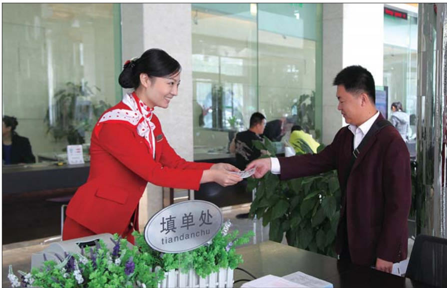
文明、优质的金融服务。

需求增加的机遇,创新信贷产品,逐步将城市居民的消费信贷品种引入到农村市场,同时,拓展对农村二三产业特别是服务业的信贷支持,提高农民生活水平。大力扶持一批特色产业的发展扶持,催生了一方经济产业。目前,初步形成了曹县的芦笋罐头加工、定陶蔬菜大棚种植、鄄城人发制造、东明西瓜、成武大蒜等产业基地,不仅成为农民发家致富的组织者、引领者,更为支持新农村建设趟出了一条新路,达到了“政府满意、农民受益、信用社增效”三方共赢局面。