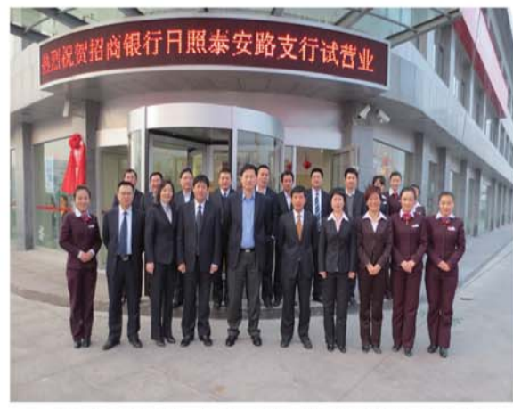
•2012年12月21日，招商银行日照泰安路支行正式对外营业，这是招商银行日照分行成立的第一家支行。

•2014年，招商银行日照分行将进一步加快网点建设力度，还将新设2家支行，争取形成以7家支行网点、13家自助银行组成的20家物理网点，搭建起辐射全市的服务体系。