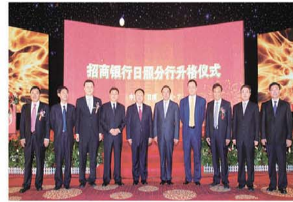
•2012年7月3日，招商银行日照分行隆重举行升格仪式。