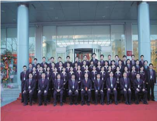
•2008年12月22日，招商银行日照支行成立。