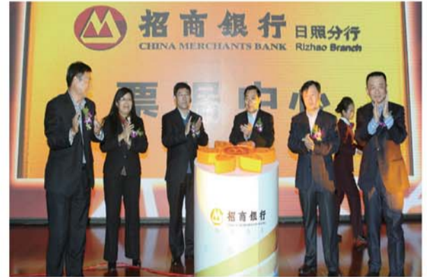
•2012年12月21日，招商银行日照分行票据中心挂牌成立。

•2014年，招商银行日照分行将进一步加快网点建设力度，还将新设2家支行，争取形成以7家支行网点、13家自助银行组成的20家物理网点，搭建起辐射全市的服务体系。