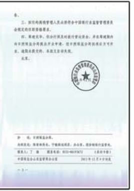
•2013年12月5日，招商银行日照岚山、莒县支行正式获得山东银监局筹建批复，预计2014年年初开业。