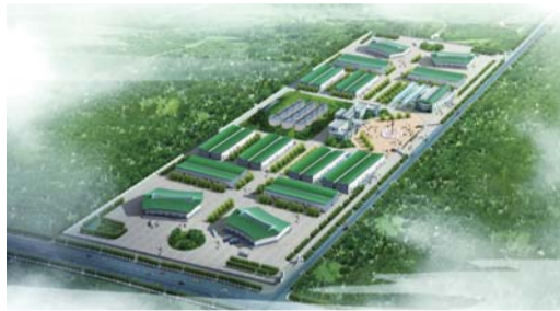
20万吨的循环经济产业链,为全球坚果行业瞩目!他们是万思顿农业产业园有限公司。

并拥有4条全球最先进的进口设备生产线,实现了年加工10万吨壳腰果原料,腰果壳油2万吨、腰果壳渣生物燃料