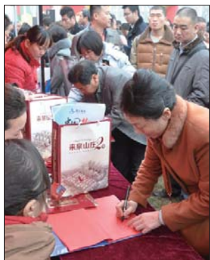
近日,昂立来泉山庄二期封顶仪式上,商家给新老客户送出了买房送台湾双飞8日游大奖。

人气不足是当前新城发展所面临的主要问题,不少人购置了房产却不在新城居住,一些业内人士对此认为,一方面源于生活配套的缺失,另一方面缺乏吸引入驻的需求。