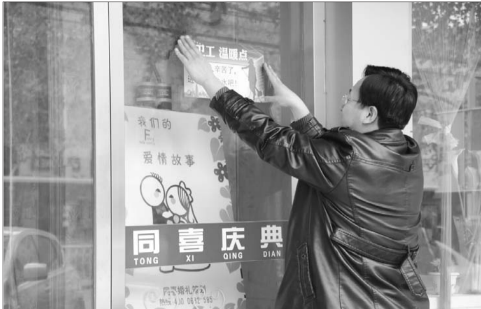
26日下午,同喜庆典加入到送温暖队伍中来。

为了引导社会力量对环卫工工作环境的关注,增加对环卫工的关怀,本报面向社会征集向环卫工义务开放的取暖点。全市各大小酒店、商超、临街企事业单位均可报名,在寒冬中为环卫工送上温暖。有意者请将单位名称、地址、联系人姓名和电话发送至shoujipiaiz@163.com,咨询电话15863231146。我们将会制作印有“环卫工温暖点”的标识贴放置到您门面的醒目位置,以方便环卫工寻找。