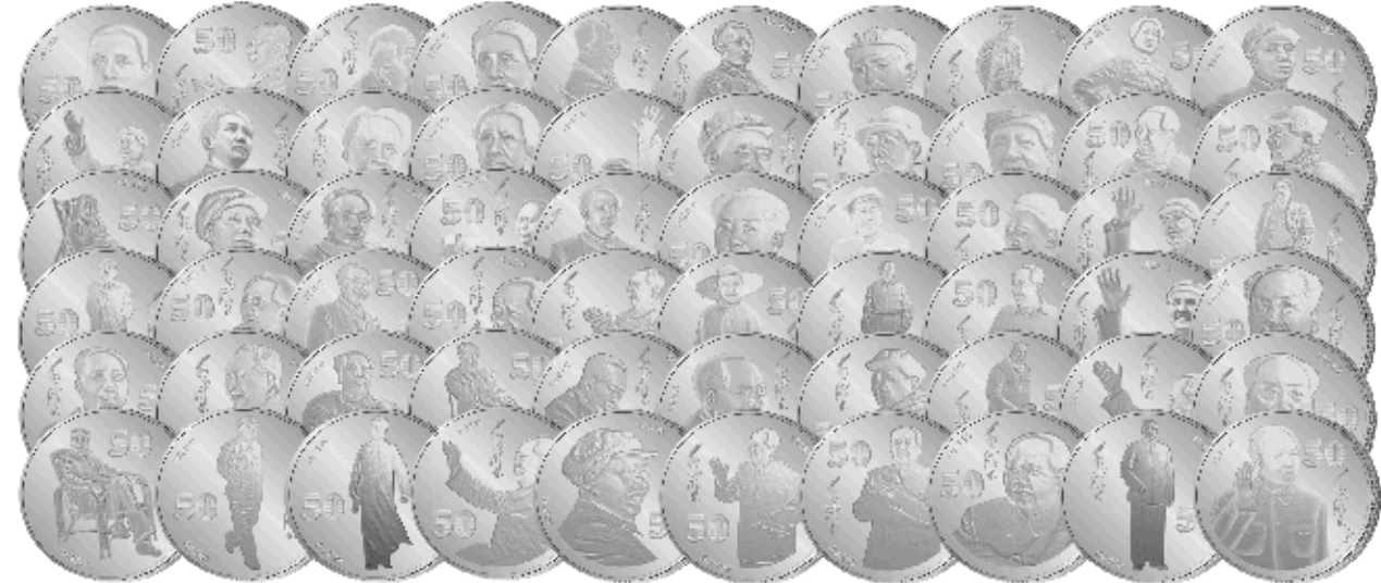
金首套“东方红毛主席金币大全套”,金币以西国图案特别铸就“毛主席去安源”、“天安门主席像”、“开国大典”等毛主席一生重要历史瞬间,采用纯金工艺铸造,金币背面精雕细刻毛主席去安源、天安门、长征、革命圣地井冈山等,按照展现了毛主席从开国大典到南海,缔造新中国的伟大历史瞬间。

■世界元首史上恢弘巨作,毛主席诞辰120周年华诞最崇高献礼!■中国伟人传记纪念品组委会监制,毛泽东特许产品组委会出品!■首发价仅2950元超低发行,60枚金币前所未有,绝对物超所值!