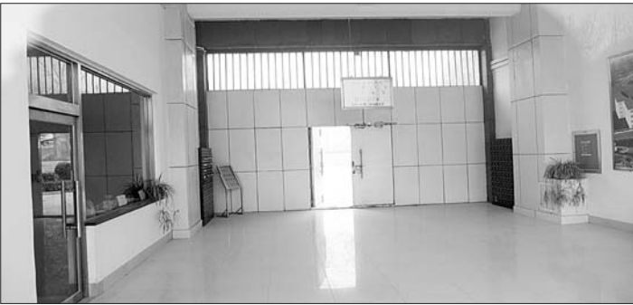
12月23日,济南市劳教所的教学楼已经见不到劳教人员。

北京理工大学法学院教授徐昕表示,监狱系统可分为重刑监狱与轻刑监狱,以后违反社会治安的人可由社区矫正机构和轻刑监狱“吸收”,形成重刑改造、轻刑管教、微刑矫正的刑罚执行“三分层格局”。