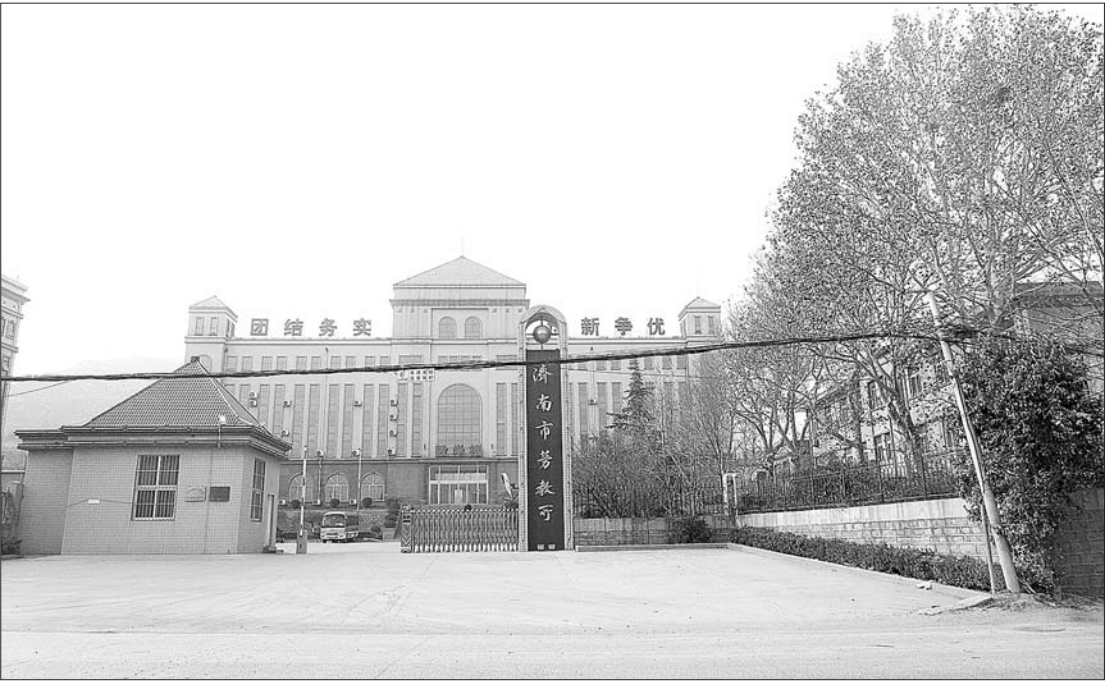
12月23日,济南市劳教所一片冷清,除了部分上班的工作人员,这里已见不到劳教人员的身影。