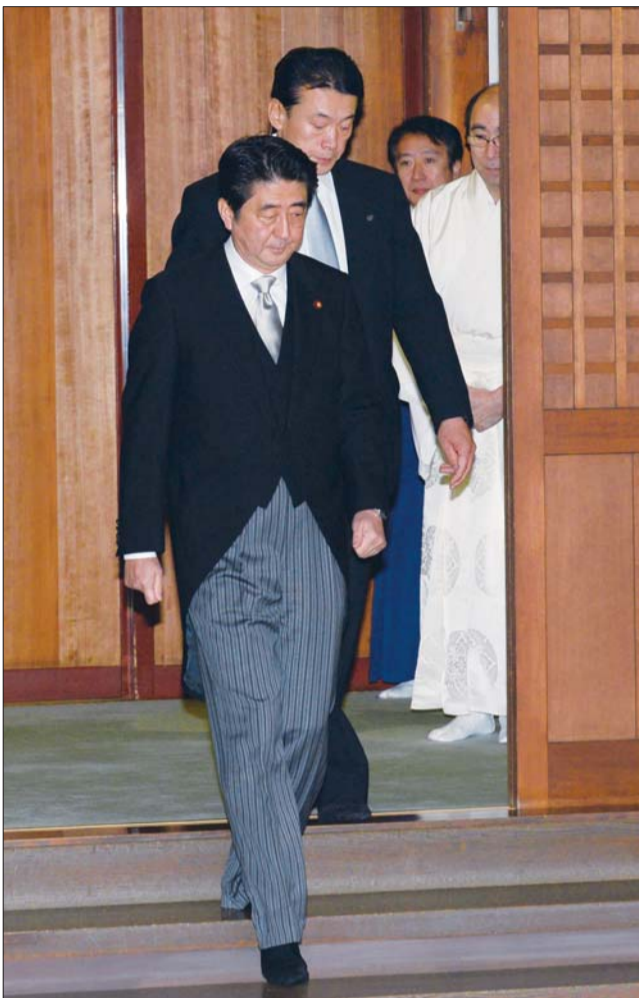
26日,安倍晋三(前)参拜靖国神社。

日本《朝日新闻》27日刊文说,参拜靖国神社问题,事关日本领导人如何认识侵略战争等历史认识问题。战后日本人发誓永不再战,但是安倍执意参拜,只能说他在表达完全相反的态度。安倍“不想伤害邻国民众感情”的说法成立吗?