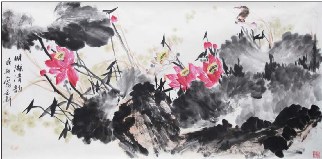
▲明湖清韵 124x248cm 尹延新