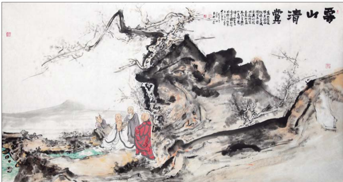
▲云山清赏 97x180cm (徐永生、常朝晖合作)