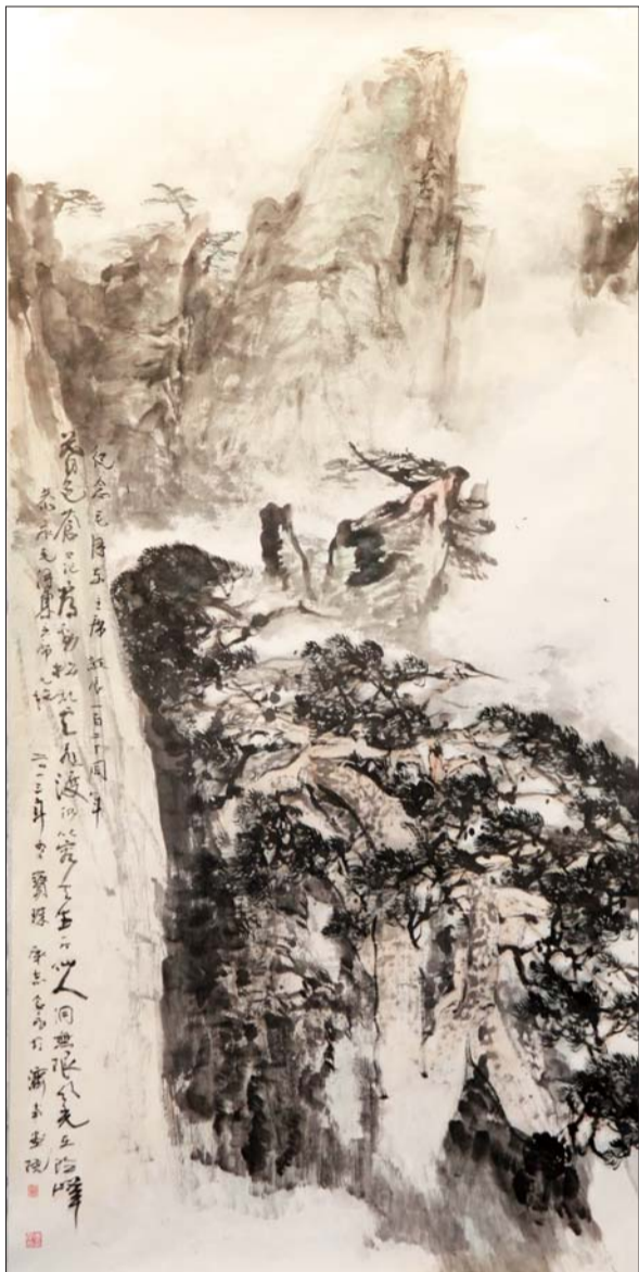
▲无限风光在险峰 124x248cm (张宝珠、李承志合作)