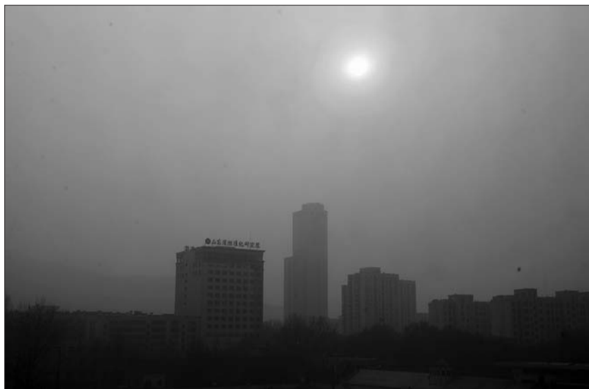
3日,济南再现雾霾天,中午时分,市区一片昏黄,连太阳也失色了。

近日具体天气预报: 4日夜间到5日白天,全省天气多云转晴。最低气温:内陆地区-4℃左右,沿海地区-1℃左右。5日夜间到6日白天,全省天气晴转多云。最低气温:内陆地区-3℃左右,沿海地区-2℃左右。