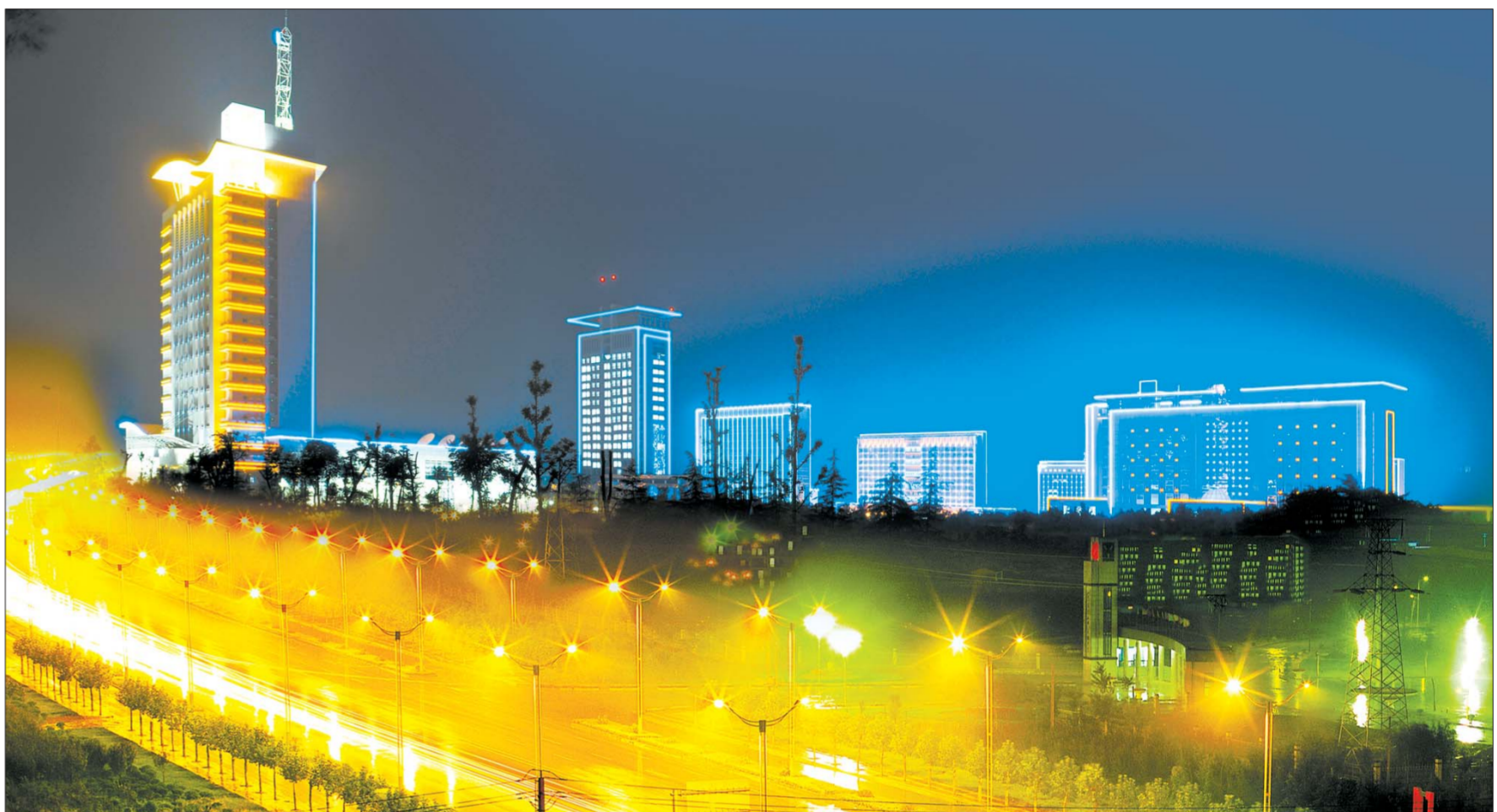
▲夜色下的章丘。(资料片) ▲生态章丘建设近年来取得长足发展。(资料片)

屏山高效林果示范园等36个基地园区提档升级,引领优质农业发展。建设现代农业信息中心,创新公用品牌推广管理,提高名优农产品市场竞争力。