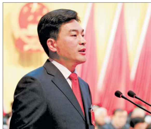
1月6日,章丘市第十六届人民代表大会第三次会议在章丘市文化中心举行,市长刘天东作政府工作报告。

2014年经济社会发展的主要预期目标是:生产总值增长9%,全社会固定资产投资增长21%,地方公共财政预算收入增长10%,社会消费品零售总额增长14%,城镇居民人均可支配收入增长11%,农民人均纯收入增长12%。