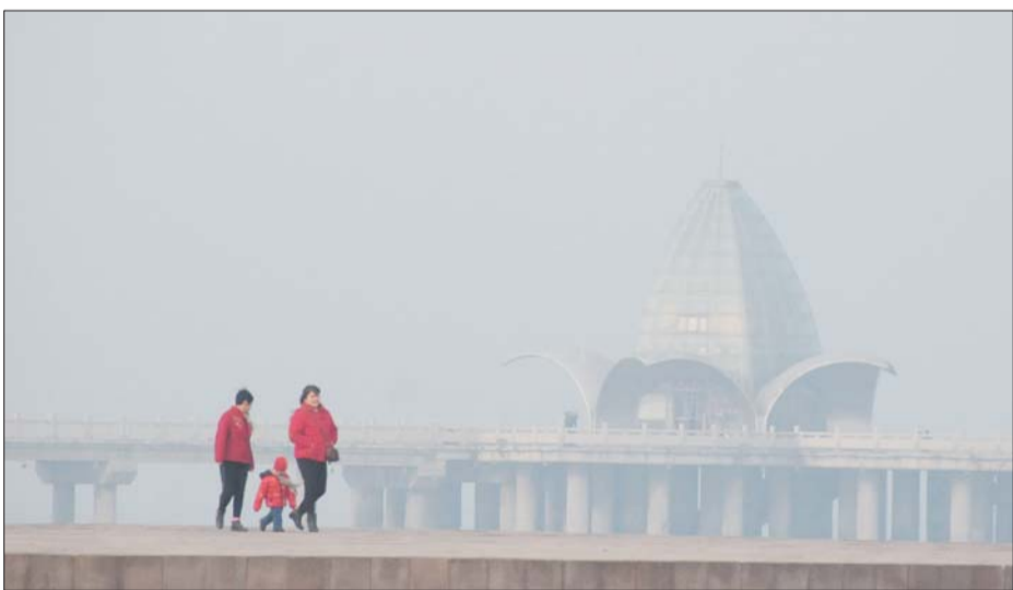
6日,滨海路旁的海边,游人在雾中行走,背后白茫茫一片,海天模糊难辨。本报记者 韩逸 摄