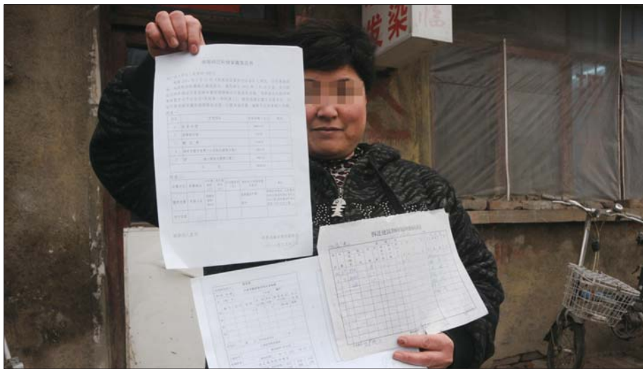
一村民展示存在补偿纠纷的房屋资料。

刘兴梁说,当初承诺有两种补偿方式,一是房屋安置,在被拆迁居住正房建筑面积基础上增加10%计算安置面积,根据安置面积大小,选择与之相近户型面积的住宅楼房。安置楼房暂时按平均成本价850元/平方米计算,超出安置面积部分按照1600元/平方米计算,可用拆迁补偿金抵顶,多退少补;二是货币安置,一次性支付被拆迁人房屋拆迁补偿等费用。刘兴梁选择了房屋安置。快三年过去了,十几天前,他却被告知老宅子可按协议补偿,多年前为儿子盖得婚房因证件不全,不能予以房屋安置,改为货币补偿,“三年前房价两千元,