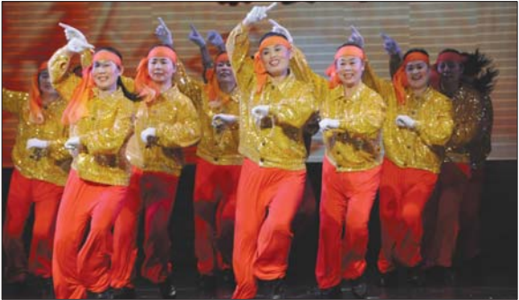
泰安市广场舞大赛决赛获奖节目。

本报泰安1月8日讯(记者 赵苏炜) 8日晚上,2013泰安市群众文化艺术年总结暨汇报演出在市文化艺术中心泰山大剧院举行,千余群众文化贡献单位和个人被表彰,一些优秀作品参与演出。