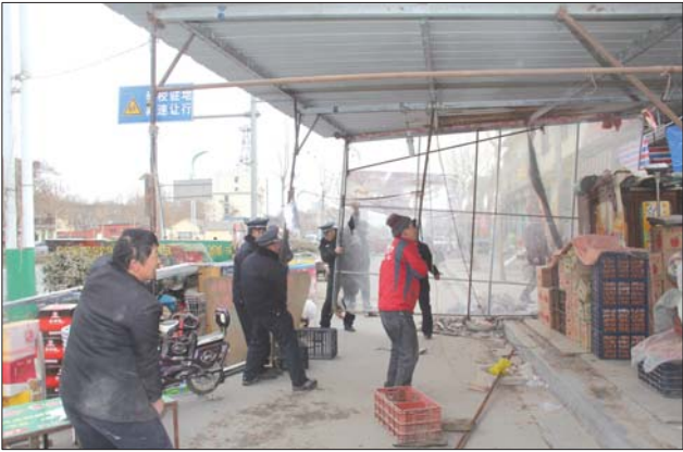
工作人员拆除棚厦。

岱庙执法所工作人员介绍,前期已经对道路两侧私搭乱建棚厦的当事人逐一做了劝导,并对23处占道棚厦下达了责令限改通