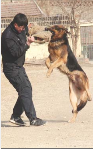
“雪狼”正在扑咬“疑犯”。

在警犬基地办公室墙上,挂着各种奖状。许晓峰介绍,自2008年以来,泰安市警犬基地参与刑事案件现场勘查、搜毒、搜爆、反恐安检行动和警卫任务