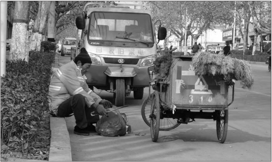
13日,一名环卫工坐在路边休息。环卫温暖点”的标识贴,爱心商家更是涉及到了各行各业。峰城义工协会的会长告 诉记者,为环卫工做的事情还有很多,除了能为环卫工提供一个喝热水和休息的地方外,还打算 协调爱心企业为环卫工人们提供一些生活必需品,让环卫工人们在这个寒冷的冬天里感到温暖。

“当我们走在干净宽敞的街上时,当你随手把垃圾扔在地上时,你是否想过这舒适优美环境的创造者呢?这一切的创造,就是勤劳伟大的环卫工人的辛勤劳动的结晶。”以上这句话是峰城义工协会发出的“温暖城市美容师的倡议书”,倡议书一经发出,就得到了广大市民的积极响应,很多市民表示非常愿意参加这个活动。经过志愿者们的细心策划和组织,在主要的几个街道对爱心商家的店铺进行张贴“环