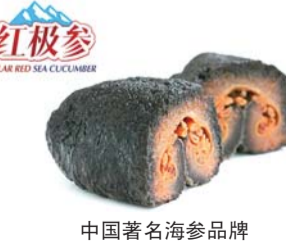
中国著名海参品牌

烟台市渔业协会举办的本次年货精品汇严格限定参展单位门槛,只确定有进出口资质的企业,保证展品质量高端安全,满足广大企业、市民采购年货的强烈需求,真正为广大消