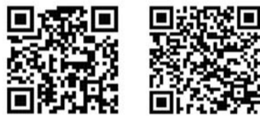
下载油耗记录仪(安卓) 下载油耗记录仪(iOS)

据了解,截至目前,“优科豪马油耗记录仪”安卓版已超过二十万人次下载,苹果版在APP下载排行榜中的排名也正快速攀升。“成为社会绝对信赖的为地球环境作出贡献的企业”是优科豪马的CSR经营理念,为此优科豪马致力于在企业内外开展绿色公益环