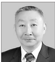
省人大代表孟鸣飞