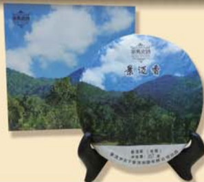
景迈香:千年古树·2012年春茶、秋茶