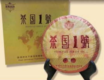
茶国一号:百年古树·2013年春茶