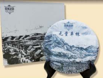
无量单株:百年单株古树·2012年春茶