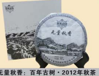
无量秋香:百年古树·2012年秋茶