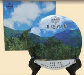
景迈秋香:千年古树·2012年秋茶