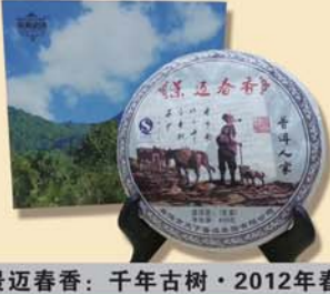
景迈春香:千年古树·2012年春茶