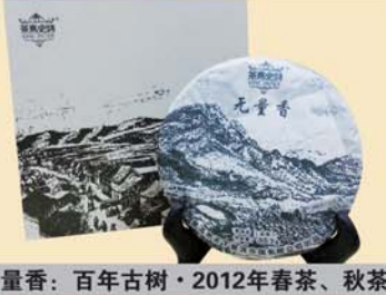
无量香:百年古树·2012年春茶、秋茶