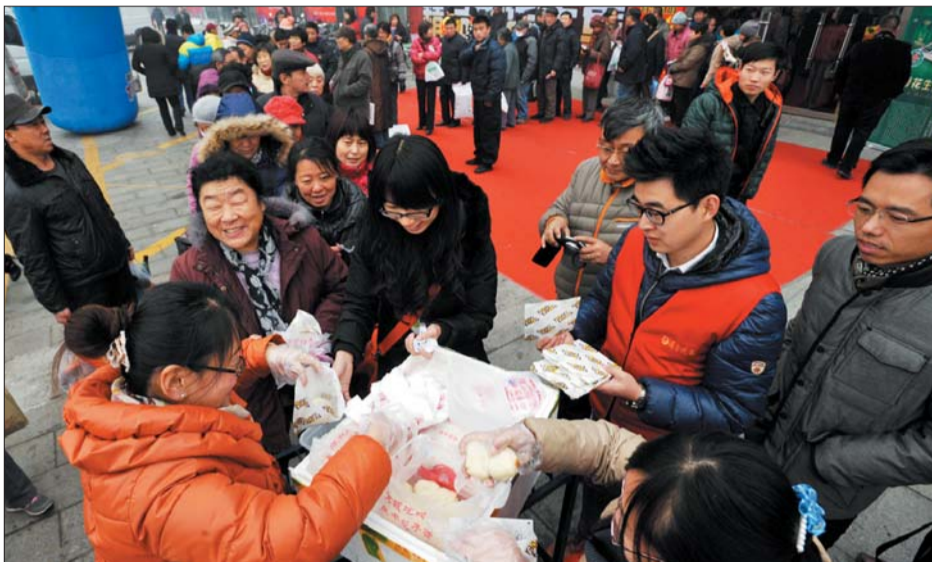
年货大集现场,市民排队领取庆丰包子,六大集将送出千余庆丰包子。

此外,为了满足更多读者的需求,96706便民网陆续增加了逍遥游、同城购、挂失分类、人才招聘、网上预约家政等服务。您只需要登录www.qj96706.com,注册成为会员后(晚报订户注册时请注明),就可直接在网上实现以上包括购物在内的所有便民生活服务,足不出户,就可轻松搞定家务事,快来体验一把吧!