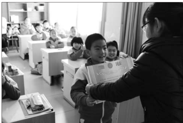
家长正在为学生颁发奖状。