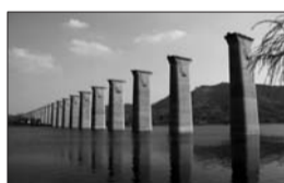
晋豫鲁铁路沂源境内线上主体工程已经基本完成(资料片)。

该线形成了一条新的西煤东运能源运输大动脉,将完善国家铁路网结构,缓解晋陕蒙煤炭能源基地的铁路运输压力。