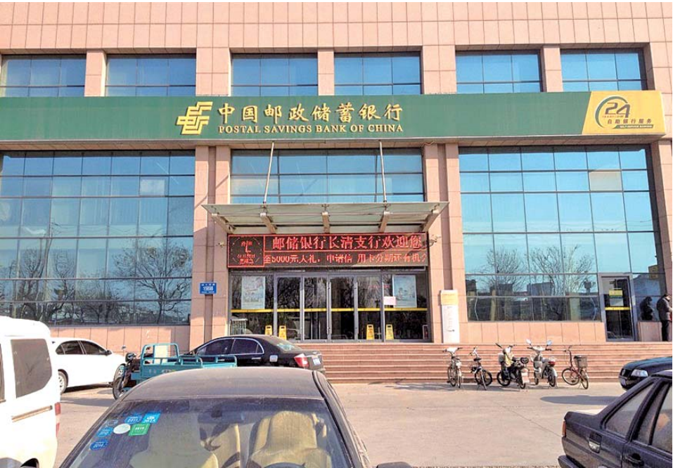
中国邮政储蓄银行长清支行。